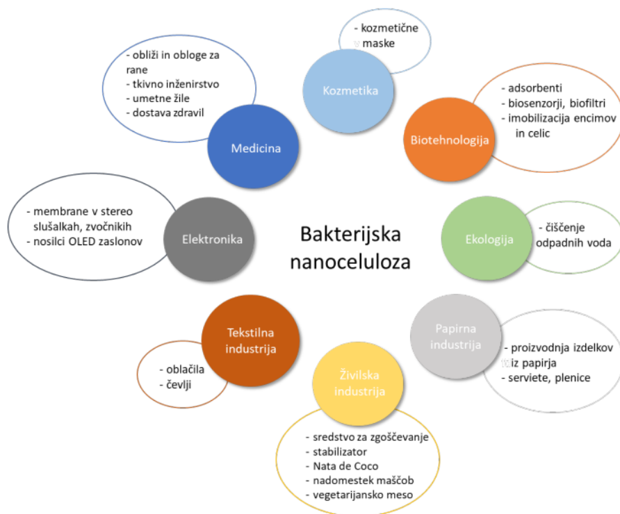
Slika 2. (REF: Jančič U. in Gorgieva S. Kemija v šoli in družbi , št. 1. 2021)

Predlagane teme se nanašajo na modifikacijo in karakterizacijo že producirane bakterijske nanoceluloze v različnih oblikah z namenom pridobitev novih struktur, ter novih, specifičnih funkcij, ki niso prisotni v osnovnem produktu. Analiza potencialne uporabnosti v specifičnih panogah (Slika 2) z uporabo relevantnih analiz, bo omogočila umestitev novega materiala na določenem področju uporabe.